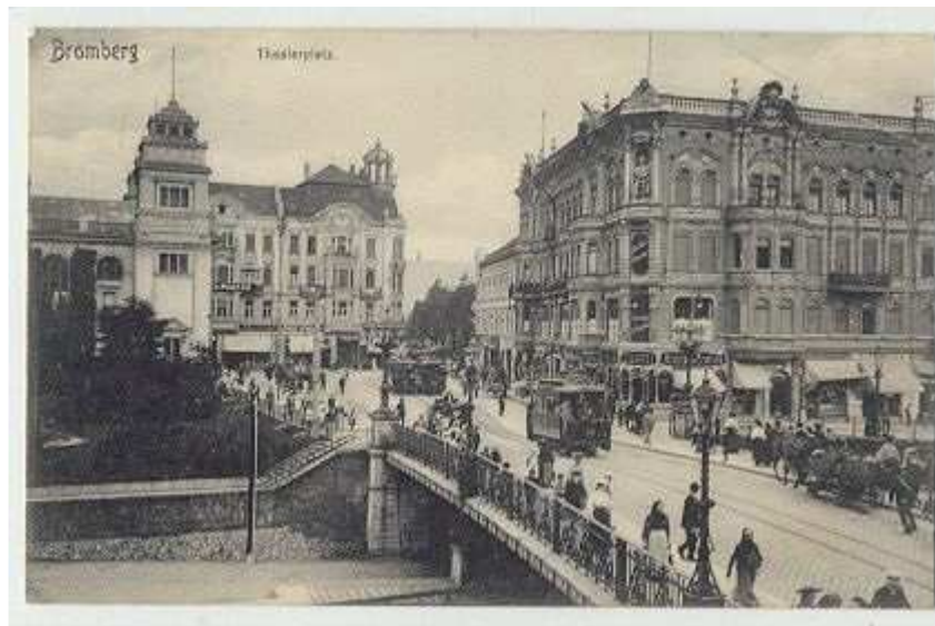
Figuur 1: Bromberg aan het begin van de 20 ste eeuw (Theaterplatz)